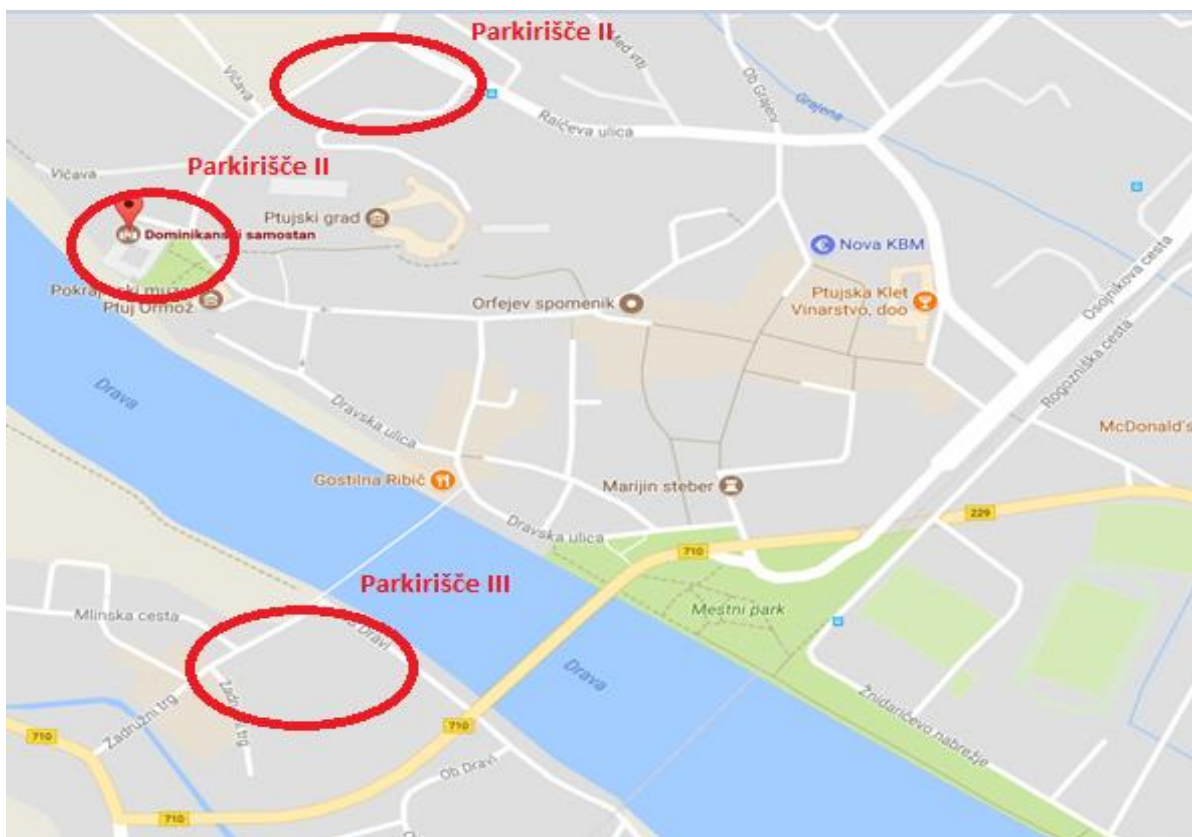
Slika 7: Možnost parkiranja

V izogiba prometnemu zastoju, na Puhovem mostu, je možno parkiranje na urejenem parkirišču Zadružni trg 15 (Parkirišče III). Z to opcijo vam je podana možnost, da si kot pešec, ogledate del starega mestnega jedra Ptuj vse do Dominikanskega samostana. Reko Dravo prečkate preko Ptujске brvi.