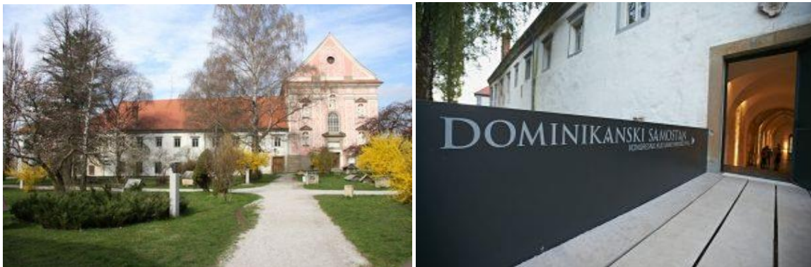
Slika 1: Pročelje Dominikanskega samostana s Sončim vrtom

Dominikanski samostan Ptuj je samostan, ki predstavlja kulturno znamenitost Ptuja.