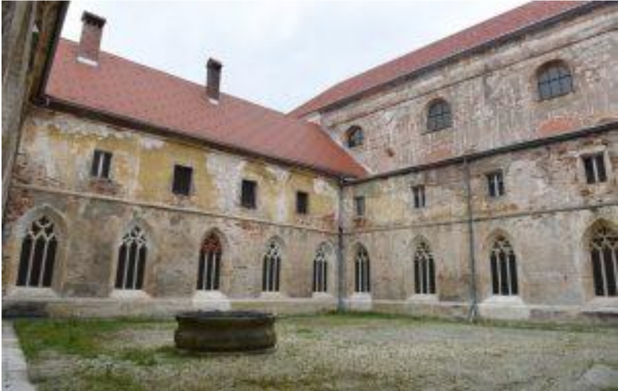
Slika 2: Dvorišče Dominikanskega samostana

Leta 1302 je samostan pogorel, obnova je trajala do srede 14. stoletja. Iz listine krškega škofa Henrika, izdane na Dunaju na Jurjevo leta 1303 je jasno razvidno, da je bilo treba na novo pozidati samostan in cerkev.