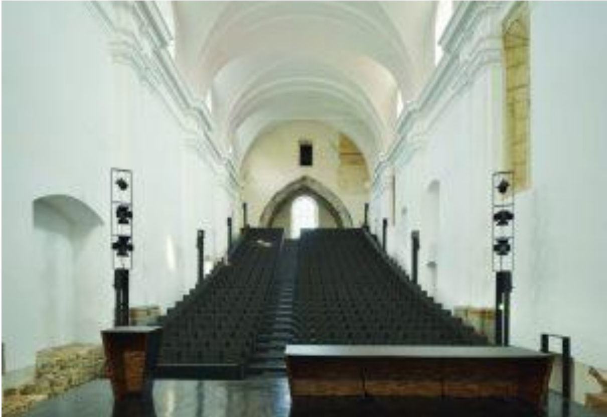
Slika 3: Cerkvena ladja – glavna prireditvenega dvorana