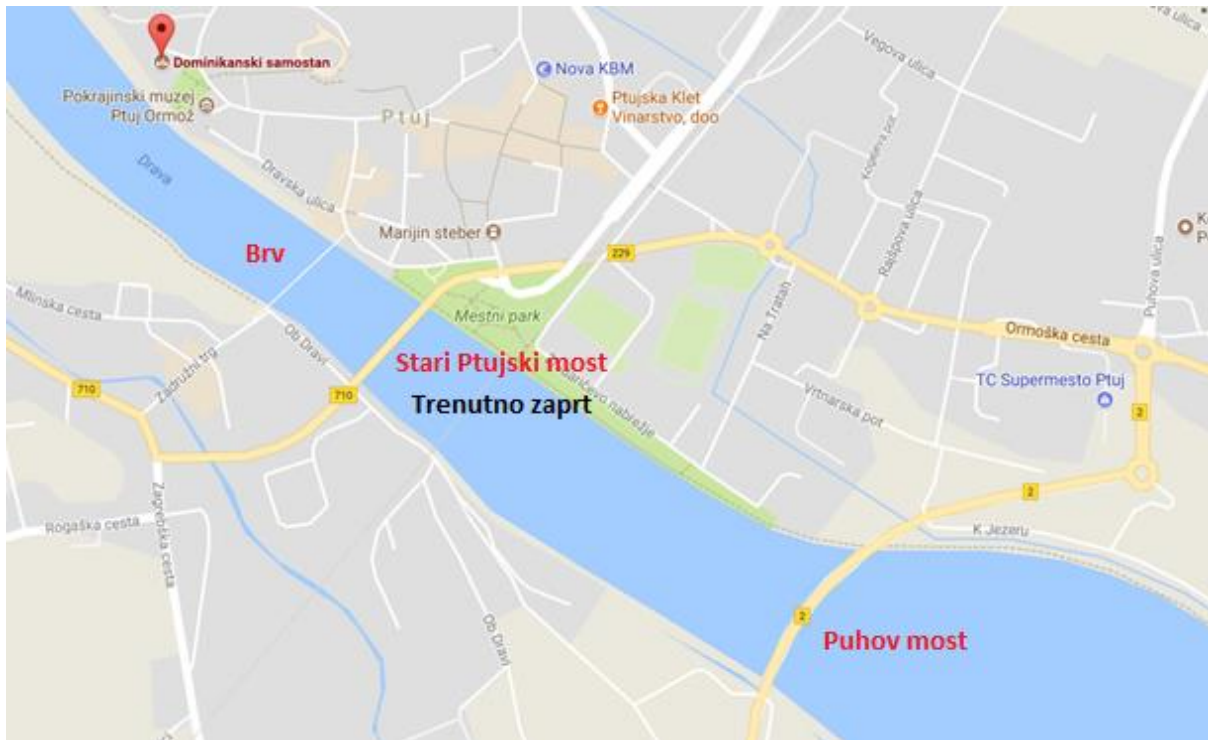
Slika 6: Prikazuje premostitvene objekte preko reke Drave