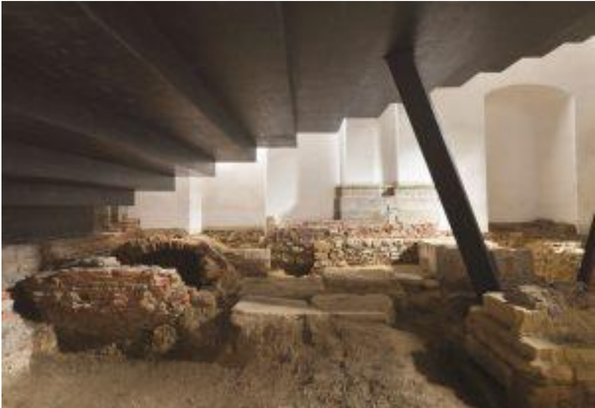
Slika 4: Arheološki ostanki